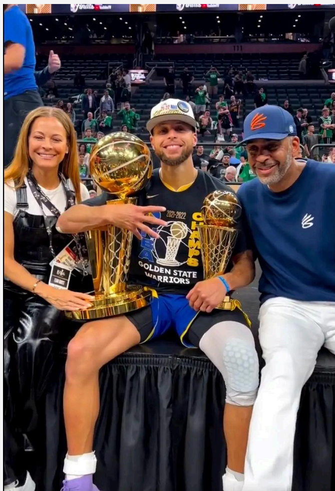
库里总决赛最有价值球员奖杯照